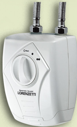
AQUECEDOR ELÉTRICO LORENZETTI 127V