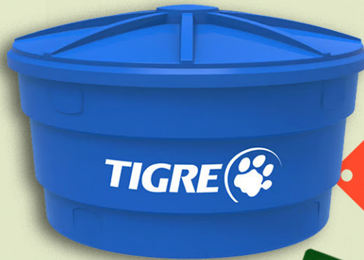
CAIXA D'ÁGUA TIGRE 750L